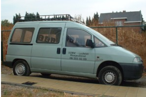
De bestelwagen van de klusjesdienst